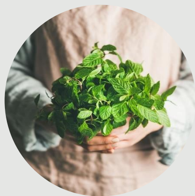
Légende de l'image : Pour donner une apparence professionnelle à votre document, Word vous propose des conceptions d'en-tête, de pied de page, de page de garde et de zone de texte complémentaires.

La lecture est également plus facile avec le nouveau mode Lecture. Vous pouvez réduire des parties du document pour vous focaliser sur le texte souhaité. Si vous arrêtez la lecture avant la fin du document, Word mémorise votre emplacement au moment de sa fermeture, même sur un autre appareil. Les thèmes et les styles vous permettent également d'obtenir un document plus harmonieux.