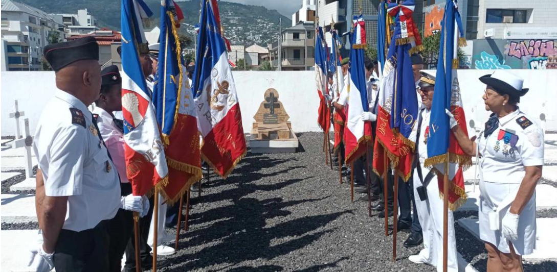
La haie des porte-drapeaux devant la tombe du Gouverneur Capagorry