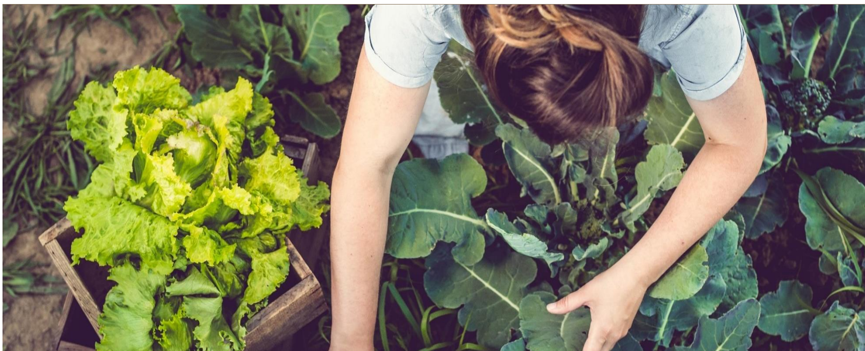
Légende de l'image : Pour donner une apparence professionnelle à votre document, Word vous propose des conceptions d'en-tête, de pied de page, de page de garde et de zone de texte complémentaires.