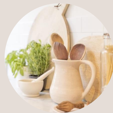
Légende de l'image : Pour donner une apparence professionnelle à votre document, Word vous propose des conceptions d'en-tête, de pied de page, de page de garde et de zone de texte complémentaires.

La vidéo vous permet d'étayer vos propos de façon efficace. Lorsque vous cliquez sur Vidéo en ligne, vous pouvez coller le code incorporé de la vidéo que vous souhaitez ajouter. Vous pouvez également taper un mot clé pour rechercher en ligne la vidéo la plus adaptée à votre document.